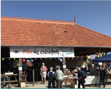
Soleil et bonne humeur, les ingrédients d'une fête réussie.