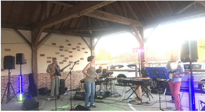
23 juin 2023, Fête de la Musique - Groupe CT - Zik Band