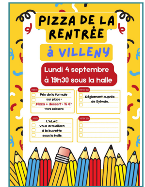
Lundis 4 juillet et 4 septembre 2023, Soirées pizzas