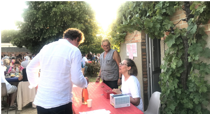
13 juillet 2023, une soirée Moules-frites organisée par le Bouchon nivollien à la Petite Maison de Simone.