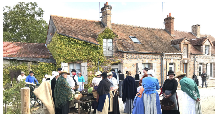
21 octobre, Projection de Courjumelle et ses villages

Retrouvez les vidéos des événements sur Villeny.fr ou Villeny Star sur YouTube