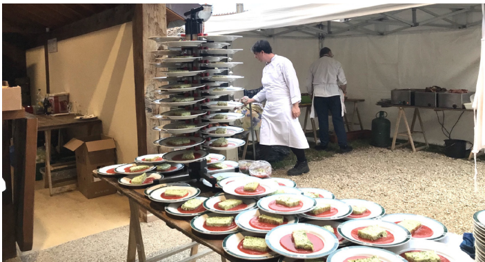
14 août 2023, 4 e édition du Banquet de l'été , avec L'Auberge de Villeny, la Ferme de Bel Air et l'ALAC.